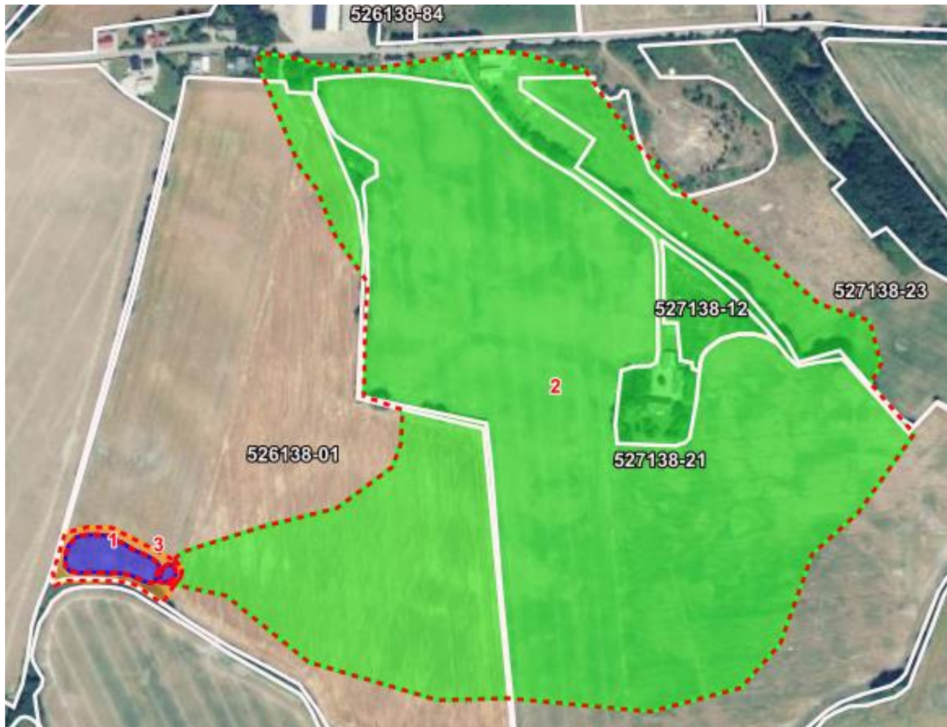
Kortbilag 3: Grøn er drænolandet, orange projektområdet og blå minivådområdets vandspejl.