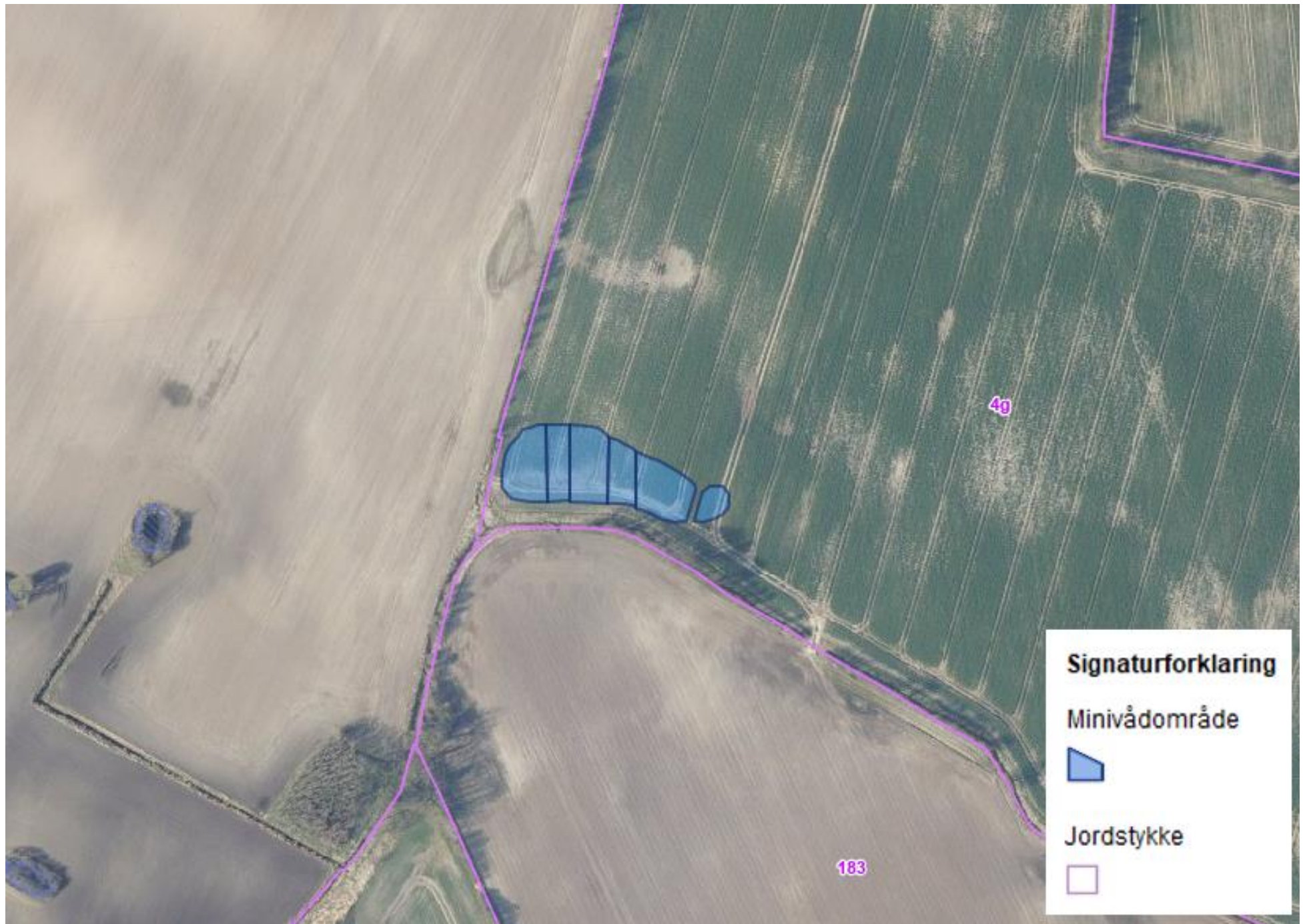
Kortbilag 1: Placering af minivådområdet.