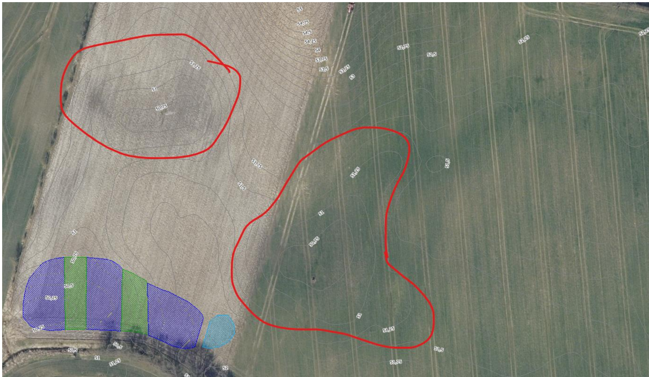
Kortbilag 2: Overskudsjorden placeres inden for de røde linjer.